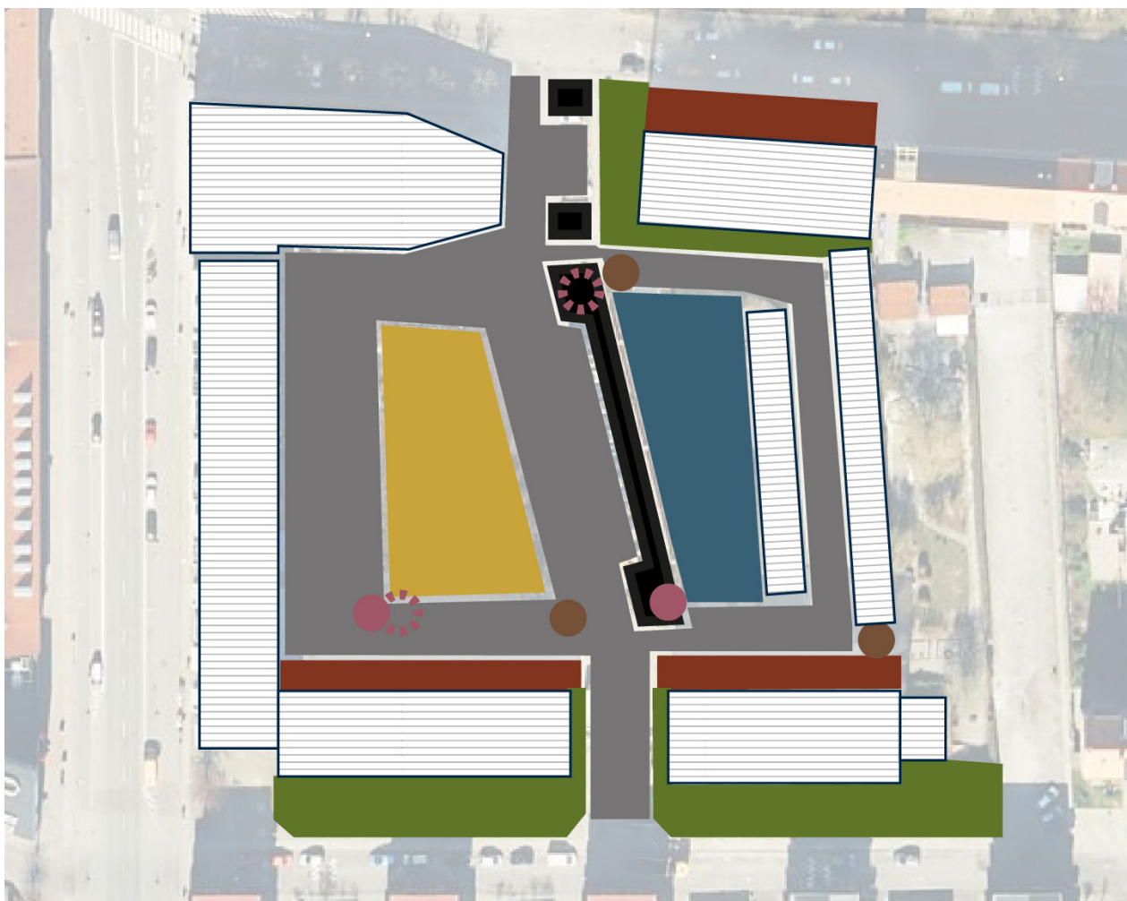
Registreringskort med kortlægning af indsatsområder